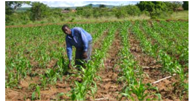
Kilimo bora cha mahindi

TOKEO LA PILI: Mbinu za kuhifadhi mazao na kuweka bajeti ya chakula katika kaya zimeboreshwa.