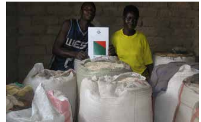
Uwekaji wa bajeti ya chakula