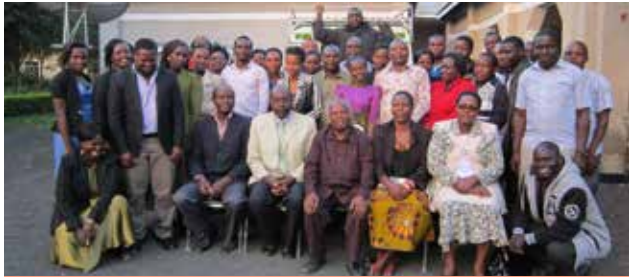
Baadhi ya viongozi na watumishi wa Shirika